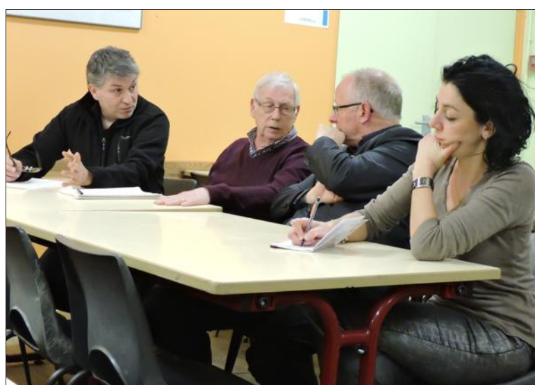
Le comité de quartier Grand-Rue/Cités-Hautes a été contraint de revoir les dates de ses manifestations pour éviter des problèmes d'organisation.

Ces changements perturbent quelque peu l'organisation initiale, mais gageons que les exposants seront néanmoins présents aux nouvelles dates. Et qu'il en sera de même pour les amoureux du VTT !