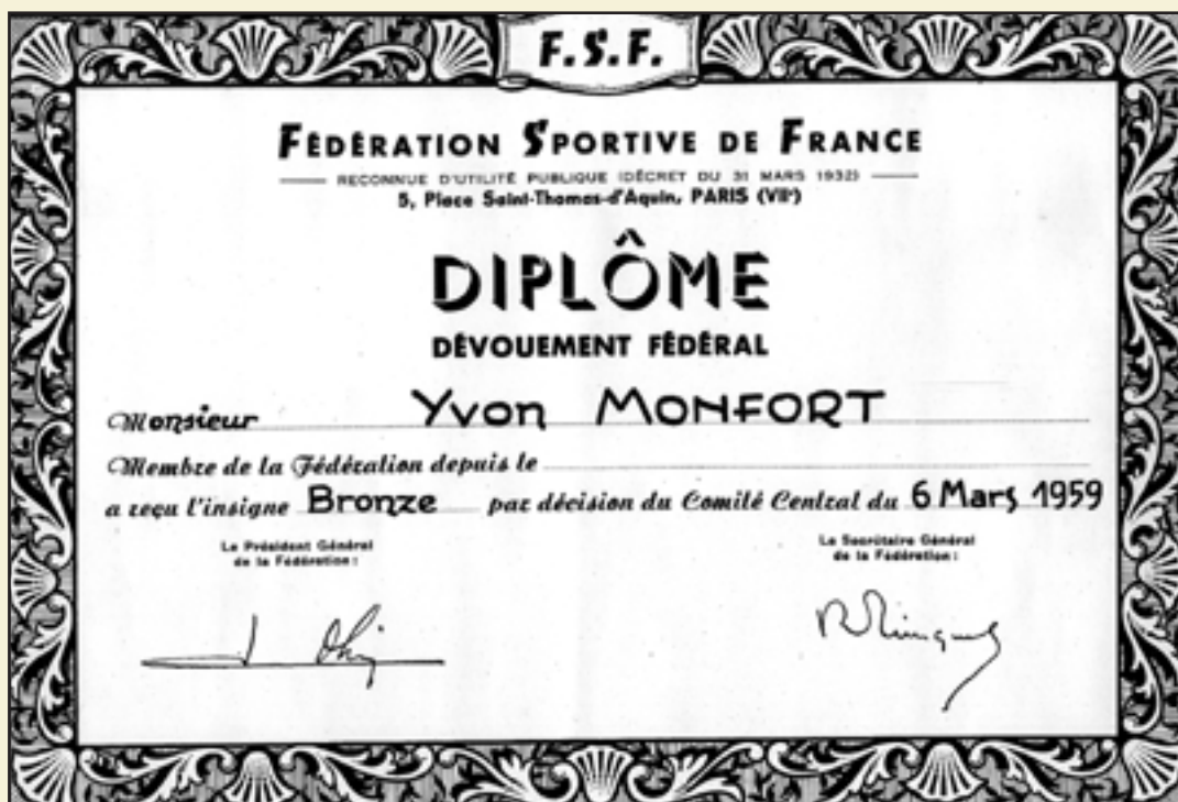
Fac-similé du diplôme de la F.S.F., attribué au secrétaire du basket, licencié depuis 19 ans, au sein de la fédération des patronages.