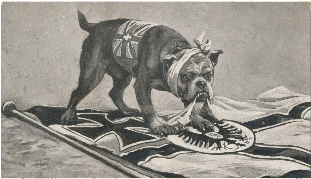
John Bull Dog déchirant un pavillon pirate. John Bull Dog tearing a pirate flag. Иванъ Буль-Догъ разрываетъ пиратскъ флагъ.