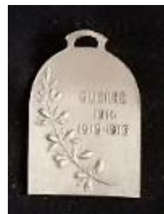
Médailles et insignes (recto/verso) de la Journée des Orphelins.