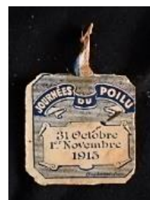
Médailles et insignes (recto/verso) de la Journée du Poilu.