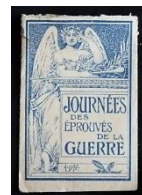
Vignettes distribuées lors de la Journée des éprouvés de la guerre.