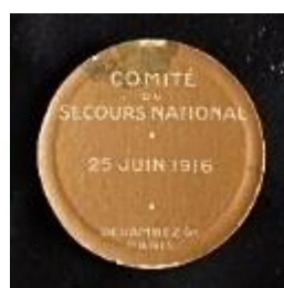
Médailles et insignes (recto/verso) de la Journée serbe de juin 1916.