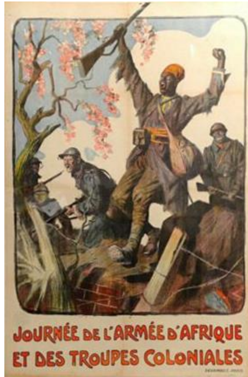
JOURNÉE DE L'ARMÉE D'AFRIQUE ET DES TROUPES COLONIALES