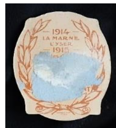
Insignes (recto/verso) de la Journée de l'armée d'Afrique et des troupes coloniales.