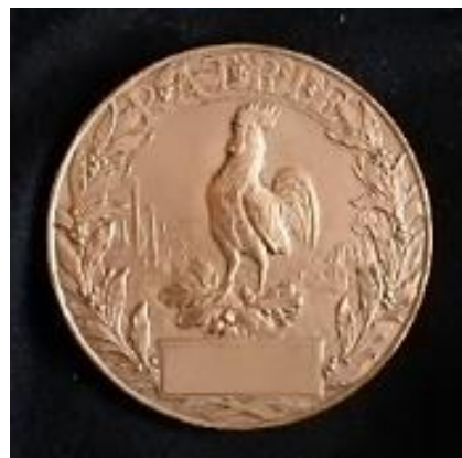
Médailles et insignes (recto/verso) de la Journée française du "Secours National".