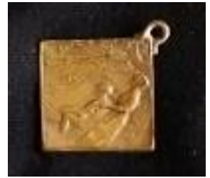
Médailles et insignes (recto/verso) de la Journée des tuberculeux.