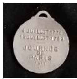
Médailles et insignes (recto/verso) de la Journée de Paris.