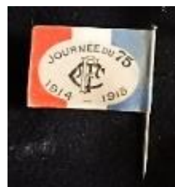
Médailles et insignes (recto/verso) de la Journée du canon de 75.