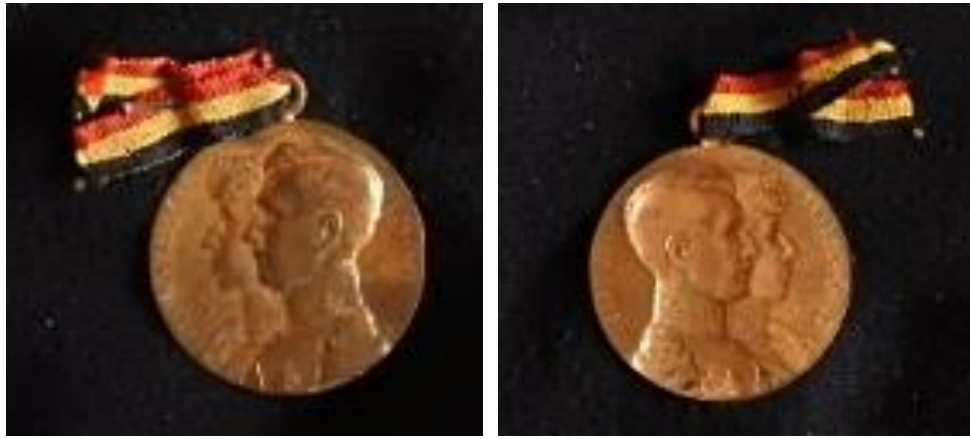
Médaille (recto/verso) de la Journée du petit drapeau belge.