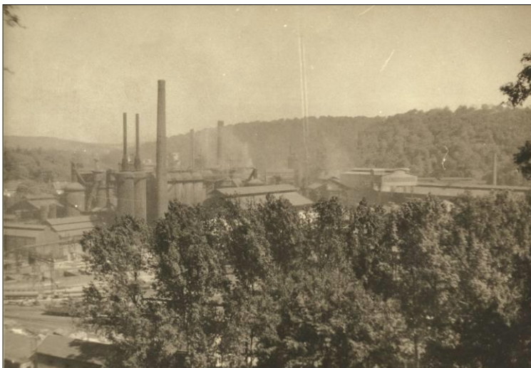
Vue générale des Forges de Jœuf en 1947. Non visibles sur le cliché, les Grands Bureaux sont situés plus à gauche de la Division des Hauts Fourneaux qui domine le site de l'usine.

et d'employés et de leurs chefs de bureaux. Ils ne sont malheureusement pas tous identifiés et les lecteurs pourront peut-être nous aider à compléter les légendes des photos présentées.