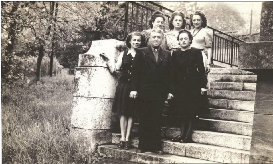
Groupe d'employées des Grands Bureaux des Forges de Jœuf, posant sur les escaliers à l'arrière du bâtiment avec un supérieur hiérarchique (?)