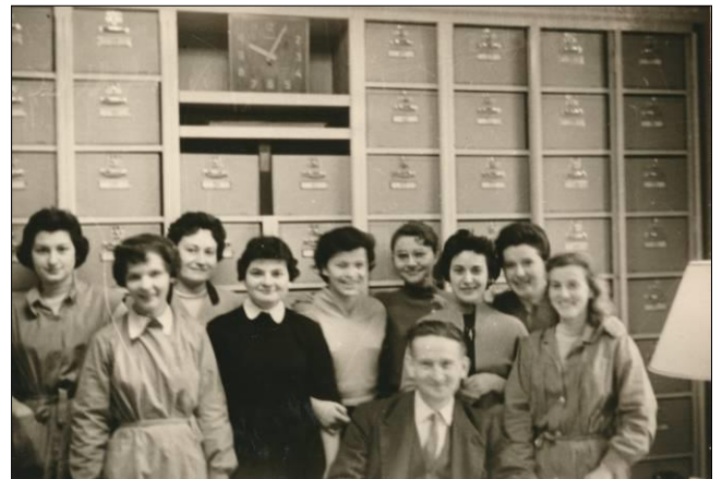
Deux groupes de jeunes femmes employées aux Grands Bureaux des Forges de Jœuf (clichés datés du 30 novembre 1957).