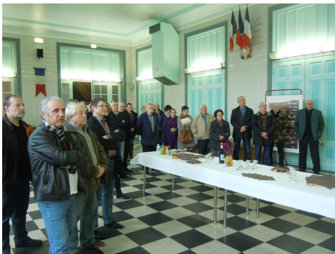
L'assemblée à l'écoute des discours.