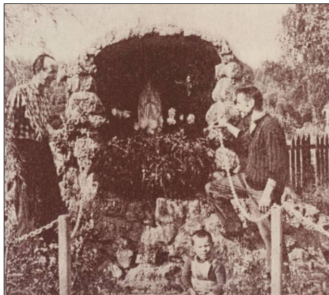
Le manoeuvre et le chauffeur sur locomotive à vapeur en tenue de travail dans le jardin de Ravenne (cliché G. Eustache, archives CPHJ).

Extrait de la page 187 du recensement de 1962, attestant que les famille Lhote et Thiébaud résident respectivement aux n° 111 et 113 de la rue de Ravenne (archives municipales).