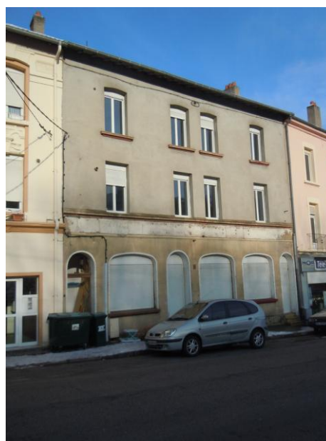
Vue extérieure de l'ancienne salle Gaspard en janvier 2013.